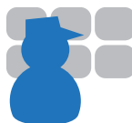
Centre opérationnel PC sécurité Télésurveillance