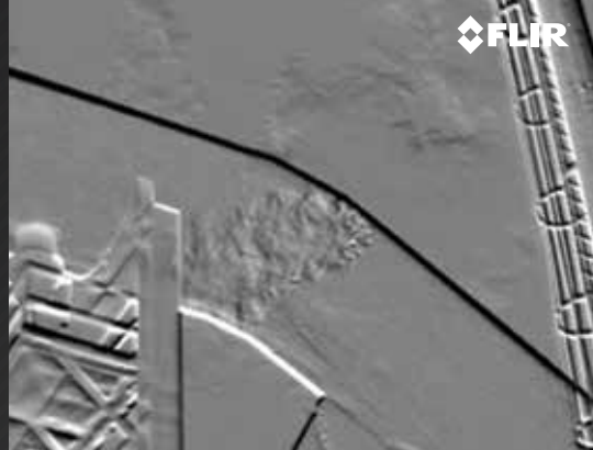
REPÉREZ LES FUITES DANS LES ACIÉRIES

Inspectez les coupe-circuits des postes électriques pour repérer les fuites d'hexafluorure de soufre (SF 6 ) à distance de sécurité des zones à haute tension, sans avoir à interrompre les opérations.