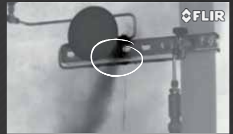
UN MANDÈTRE PRÉSENTANT UNE FUITE