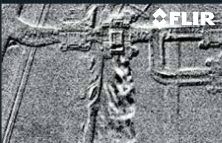
FUITE DE CO 2