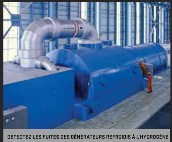
DÉTECTEZ LES FUITES DES GÉNÉRATEURS REFROIDIS À L'HYDROGÈNE

Analysez rapidement et à bonne distance des milliers de connexions à la recherche de fuites de gaz naturel (méthane) et d'autres hydrocarbures pour éviter les infractions à la réglementation, les amendes et les pertes de revenu.