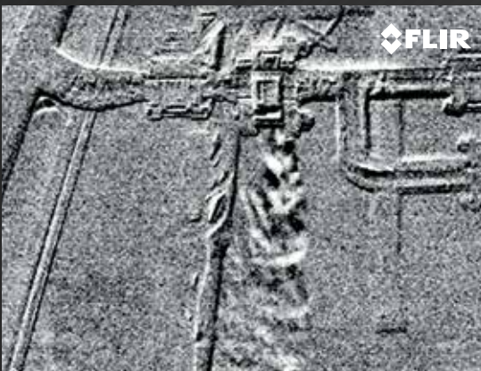
IDENTIFIEZ LES FUITES DE CO 2 DIFFICILES À LOCALISER

Protégez les employés et l'environnement des niveaux toxiques de monoxyde de carbone (CO) en repérant rapidement et efficacement les fuites.