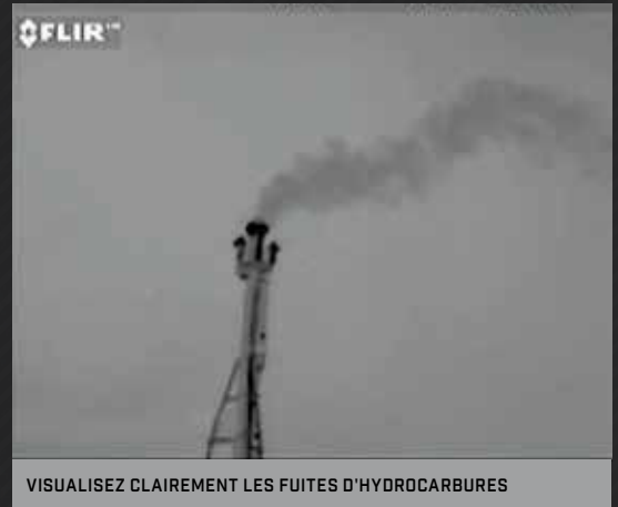
VISUALISEZ CLAIREMENT LES FUITES D'HYDROCARBURES

De l'extraction du gaz naturel aux activités pétrochimiques et à la production de courant, les entreprises ont économisé plus de 10 millions d'euros par an en ressources préservées, en intégrant l'imagerie optique des gaz FLIR à leurs programmes de détection et de réparation des fuites (LDAR).