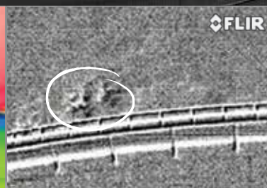
MODE HAUTE SENSIBILITÉ