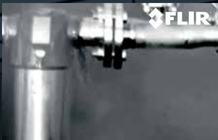
FUITE DE CO 2 - IMAGE INFRAROUGE