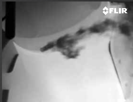
DÉTECTEZ LES FUITES DU COMPRESSEUR R-124

Évitez les interruptions d'activité en détectant précocement les fuites de dioxyde de carbone (CO 2 ) lors de la production de substances chimiques, les activités de fabrication et les programmes de récupération assistée du pétrole.