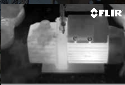
COMPRESSEUR A/C - IMAGE INFRAROUGE