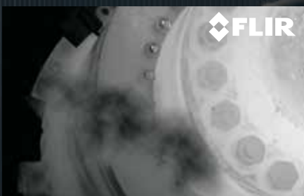
FUITE SUR UNE BRIDE