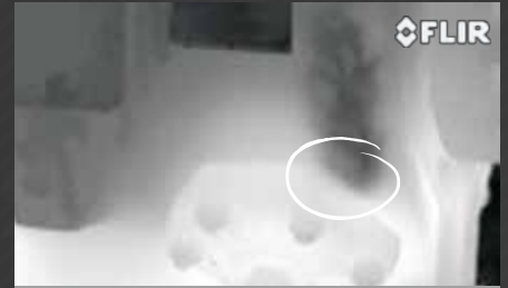
CAPTURE D'UNE FUITE DE GAZ