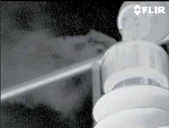
REPÉREZ FACILEMENT LES FUITES DE SF 6