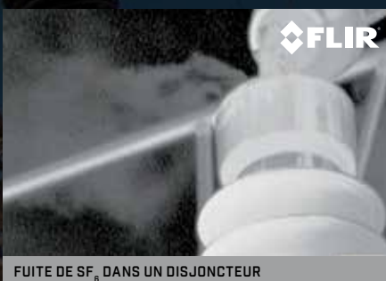
FUITE DE SF 6 DANS UN DISJONCTEUR