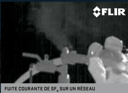
FUITE COURANTE DE SF 6 SUR UN RÉSEAU