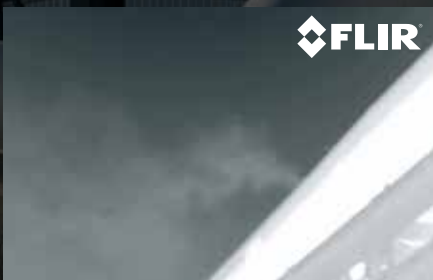
VENTILATION D'UN HAUT FOURNEAU