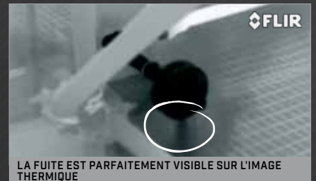
LA FUITE EST PARFAITEMENT VISIBLE SUR L'IMAGE THERMIQUE